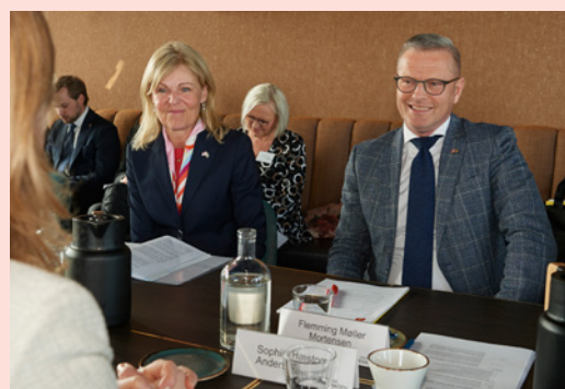
Anna Hallberg och Flemming Møller Mortensen, ministrar för nordiskt samarbete.