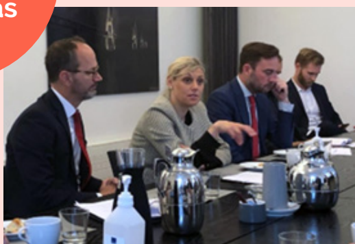
Tomas Eneroth, Sveriges infrastrukturminister och Trine Bramsen, Danmarks transportminister.