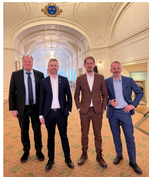
STRING och Greater Copenhagen arrangerade ett gemensamt seminarium i riksdagens trafikskott.

Ett välbesökt seminarium i Sveriges riksdag, på temat Fehmarn Bält, var en annan april-aktivitet. Det arrangerades av Greater Copenhagen tillsammans med STRING. Vid seminariet stod klart, att bristen på samplanering mellan Danmark och Sverige får stora konsekvenser den dagen Fehmarn-förbindelsen tas i bruk.