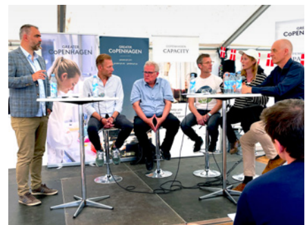
Det var full fart i tältet "House of Greater Copenhagen" vid Folkemødet på Bornholm.

"Erhvervsfyrstårnet Life Science – Sund Vikt" är ett nationellt tillväxtinitiativ, som Greater Copenhagen varit med om att etablera. Det ska stärka samarbeten i regionen för att utveckla lösningar för globala hälsoproblem inom övervikt. Greater Copenhagen främjar partnerskap och samarbeten mellan Sjælland, Skåne och Halland, så att hela Greater Copenhagen-regionen täcks in. Genom att sammanföra kunskaper, erfarenheter och tekniska lösningar som finns här, kan globalt attraktiva produkter utvecklas, som ytterligare stärker den tydliga Life science-profil regionen redan har.